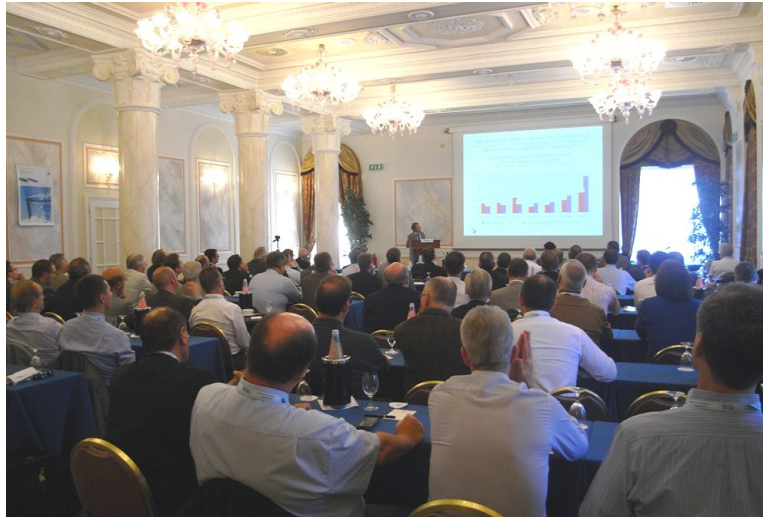
Un momento del meeting Europomp

Si è svolto a Stresa, presso il Grand Hotel des Iles Borromees, l'edizione 2012 dell'Europomp Annual Meeting che rappresenta l'avvenimento periodico più importante per l'associazione europea dei produttori di pompe. E' toccato questa volta all'Italia, ed in particolare ad Asso-pompe (Associazione Italiana dei Produttori di Pompe), ospitare e organizzare i tre giorni di lavoro. In tale occasione il professor Fortis ha tenuto una relazione su come l'industria manifatturiera stia reagendo alla crisi che, in questi anni, sta interessando il mercato globale. Successivamente sono seguiti i workshop di tutte le Commissioni Europomp.